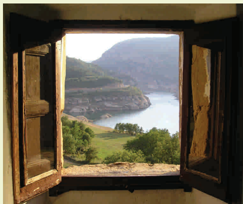
Vista al pantà des d'una de les finestres de la casa.